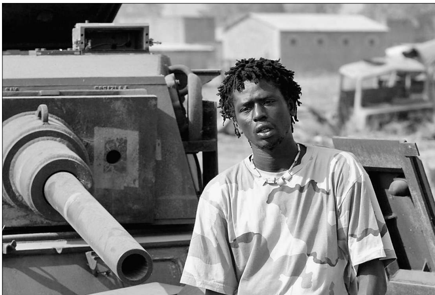
Szene aus dem Dokumentarfilm „War Child“ von Christian Karim Chrobog

Neulich hörte ich das verzweifelte Bellen von einem Ausgesetzten. Da fragte ich mich: Was würde ich tun, wenn ich Osama vorfinden würde, nur so, an einer Leine? Den Tierschutzbund anrufen? Oder ihn einfach laufen lassen? MARYAM SCHUMACHER